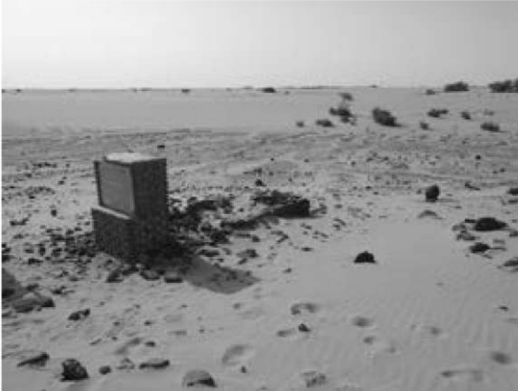
صورة رقم (7) توضح موقع اللوحة جنوب موقع أبكر

ثانياً: أن الرواية تتحدث عن البديرية الدهمشية بدنقلا ولنا وقفة في هذا الجانب، وهي أن زواج محمد دهمش من ابنة غلام الله يحتاج لبعض التحقيق والتدقيق لأن هناك روايات أسرة البادنانب في دنقلا العجوز ( القدار ) أن محمد دهمش هو جدهم ووالدتهم هي فاطمة بنت غلام الله ، وقد تزوج محمد دهمش من بنت ملك النوبة وجاب الدناقلة البديري ، من جانب آخر هناك تقول: أن غلام الله كان معلماً لمحمد بن عيسى بن صلاح (صالح) بن محمد دهمش فكيف تتفق الروايتان مع هذا الفارق الزمني الكبير - وسنفصل في هذا عند حديثنا عن التعليم الديني- كما أن هناك روايات تقول بأن مقبرة محمد دهمش موجودة من الناحية الجنوبية عند منحدر تلة صغيرة عليها آثار قلعة أبكر ، وتبعد عن النيل مسافة ميلين تقريباً (14) (صورة رقم 17،18).