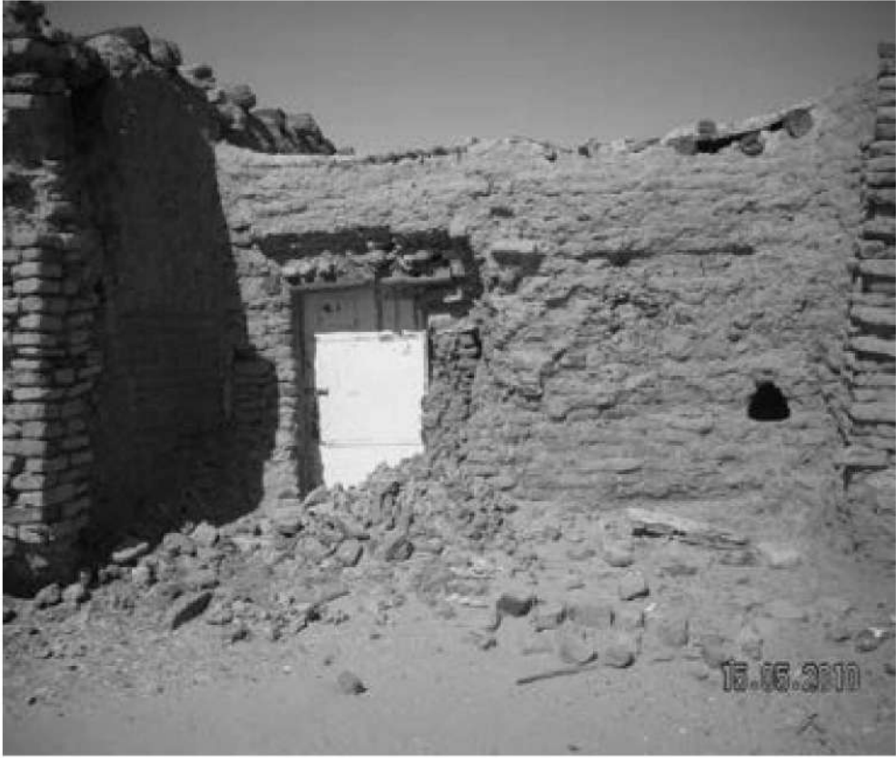
صورة رقم (16) توضح جانبا من خلوة الحلاب

أصبحت دنقلا أو الصُّلاح (بضم وتشديد الصاد، جمع صالح)، كما يطلق عليها الأهالي، وذلك لكثرة مقابر وقباب العلماء والصالحين وأصحاب الكرامات بها، أحد أهم المراكز العلمية والدينية في السودان، ونار القرآن لم تنطفئ جذوتها في خلاوي دنقلا إلى فترات متأخرة ترجع إلى أواسط القرن العشرين، ولعل آخر الشيوخ هو الخليفة محمد زيادة ميرغني (53) ، كما تجب هنا الإشارة إلى أن الروايات الشفهية تذكر أن للشيخ عووضة شكال القارح خلوة، أقام خلوة شرق خلوة غلام الله بن عايد وأصبحت فيما بعد ضريح لساتي محمد عيسى بن (سوار الذهب) وعدد من المشايخ (54) ، وغيرها من الخلاوي الأخرى، التي انتشرت في مختلف بقاع السودان، ومن أشهر خلاوي البديرية