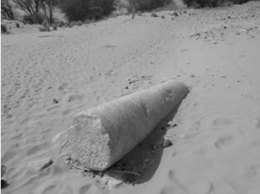
صورة رقم (4) توضح عمود الجرانيت المذكور