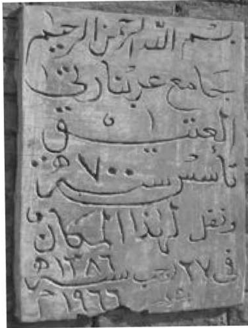
صورة رقم (17) توضح لوحة بها تاريخ تأسيس مسجد حاج بلول