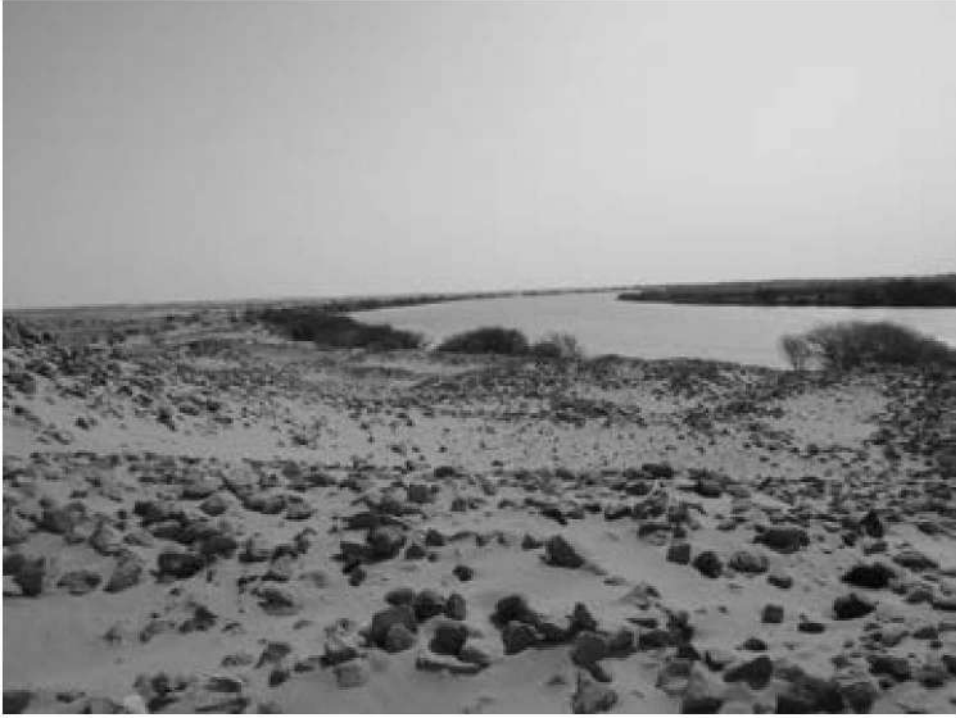
صورة رقم (1) توضح انعطاف النيل عند الدفار (تصوير الباحث)

خريطة رقم (1) توضح منطقة الدفار (لبنان، مصدر سابق، ص228)