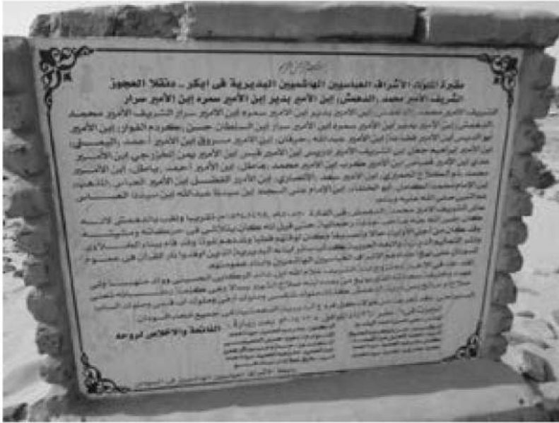
صورة رقم (8) توضح الكتابة الموجودة في اللوحة

أما قبة صلاح أو صالح - كما هو مشهور عند سكان المنطقة - تقع بالضفة الغربية لمدينة دنقلا (العجوز) في منطقة الغابة وهي معروفة بقبة شيخ أو حاج سالا، واسم سالا هو تحريف لكلمة صالح عند نطقه باللسان النوبي الدنقلاوي.