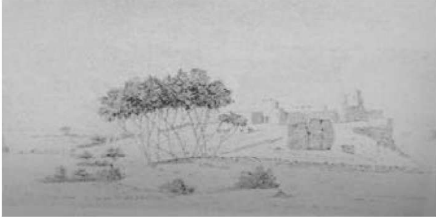
لوحة رقم (1): حصن الدفار

حجارة خشنة من الجبل، ومحاطة بجدار لازال باقياً منه بقايا أبراج مستديرة بها فرجات، وتوجد بداخلها بئر حفرت في صخر رملي وبنيت، ويبلغ عمقها خمسة وخمسين قدماً، غالباً من صنع «الأقدمين» السابقين للمسلمين، يرقد على الأرض عمود من الجرانيت طوله ثلاثة أمتار زخرف تاجه (غير المكتمل بصليب إغريقي) قارن التاج من سوبا، لاشك إنها دُفار التي جاء وصفها عند لينان في يومياته (30 سبتمبر 1821) والتي رسم مخططاً رائعاً لها (لوحة رقم 1) قال عنه أطلال قرية جميلة صغيرة على فط أبكور... خارج المجمع كان هناك عمود ساقط من جرانيت باهت، بالقرب من شجرة دوم جميلة، (يظهر المخطط العمود خلف جذع نخلة الدوم). وبالقرب جبانة إسلامية مع حجارة عند الرأس والقدمين من المرمر، لكن بدون نقش، يتضح من المخطط أن القلعة كانت على تل منحدر من الشمالية بحدة إلى النيل في الجنوب، وفي قاع المنحدر شكلت جلاميد صخر ضخمة رصت في صف (بين الناس والمركب) خليجاً صغيراً، فيما وراء ذلك الجدار الغربي لساحة القلعة التي يبدو أنها احتفظت ببقايا أبراج مستطيلة، في الجانب الشرقي، إلى اليمين من نخلة الدوم مبنى منعزل ممتد بغير انتظام ويحتمل إنه كان دفاعات عن المدخل بوابة القلعة يمكن رؤيتها بين برج مستدير في الركن الشرقي ومبنى ذي فتحات في الغرب. في منتصف الجدار الشرقي للقلعة يوجد برج مستدير ضيق به فتحتان إحدهما فوق الأخرى بين الجدار الشرقي والجزء شديد الانحدار للجانب الشرقي يوجد رصيف أو سطح ضيق يتجمع فيه المدافعون لصد هجوم على المدخل الرئيس. في البعد، غالباً في الأركان الثلاثة الأخرى. يوجد ما يمكن أن يكون أبراجاً مثلثة (12) .