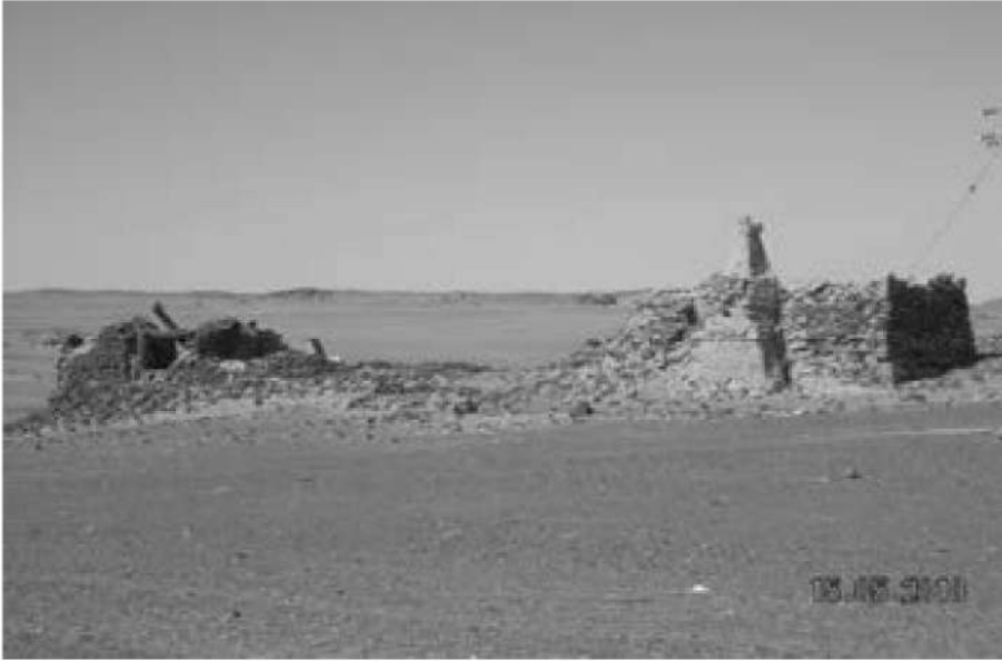
صورة رقم (15) توضح آثار خلوة ومسجد الملك عبد الله برشميو المزعوم