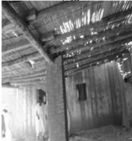
صورة رقم (18) بقايا خلوة حاج بلول بعربنارقي (الغابة)