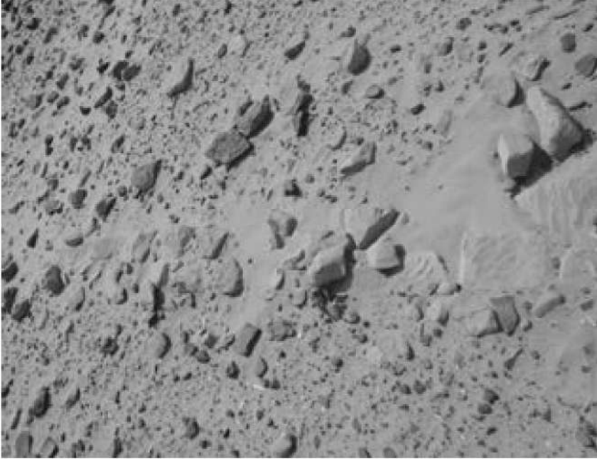
صورة رقم (2) توضح ملامح من موقع الدُّفَار

ومن الدراسات الأثرية التي تمت لموقع الدُّفَار المسح الأثري لقطاع جنوب دنقلا (موسم 1998م) حيث تم وصف الموقع بأنه تعرض لدمار كبير خلال المائة وخمسون عاماً الماضية، وأن الحصن حقل كبير من الحطام؛ وهو عبارة عن ركام من الحجارة والطين والرمال لا شكل واضح له تمتد بطول 250 متر على ضفة النيل، ورغم ذلك مازال في المكان موقع كنيسة مع بعض قوائم أعمدة جرانيتية، وبقايا تاج جرانيتي في الجوار وتاج عمود على بعد مائة متر، ويضم الموقع بعض البيوت الحديثة (13) ، أما دراسة الفخاريات في الموقع خلصت إليه أنه كان يمثل أحد مواقع الفترة المبكرة لمملكة المقرة وكانت مأهولة بالسكان في بداية العهد المسيحي وأواخره وفي العصر الإسلامي، وتقتصر الدراسة أن سكان العهد الإسلامي تحركوا بكثافة نحو المواقع المسيحية الأولى (14) (صور رقم 2_3_4).