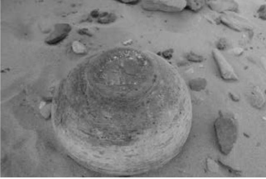
صورة رقم (3) توضح أنية فخارية ما زالت بصورة جيدة من الموقع