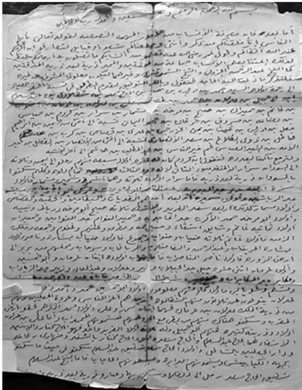
وثيقة رقم (1) توضح نسب أسرة قسوة توك وهي منسوخة من الوثيقة الأصلية ( منزل خالد سر الختم - بري الخرطوم )