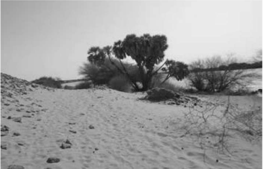
صورة رقم (6) توضح أساسات مسجد أولاد جابر شرق شجرة الدوم