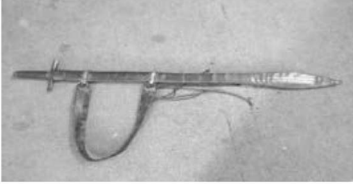
صورة رقم (11): سيف مملكة الدفار الموجود لدى أسرة قسوة توك