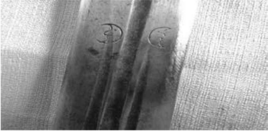
صورة رقم (13): رموز ونقوش على السيف