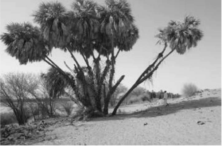
صورة رقم (5) توضح شجرة الدوم بالقرب من النيل