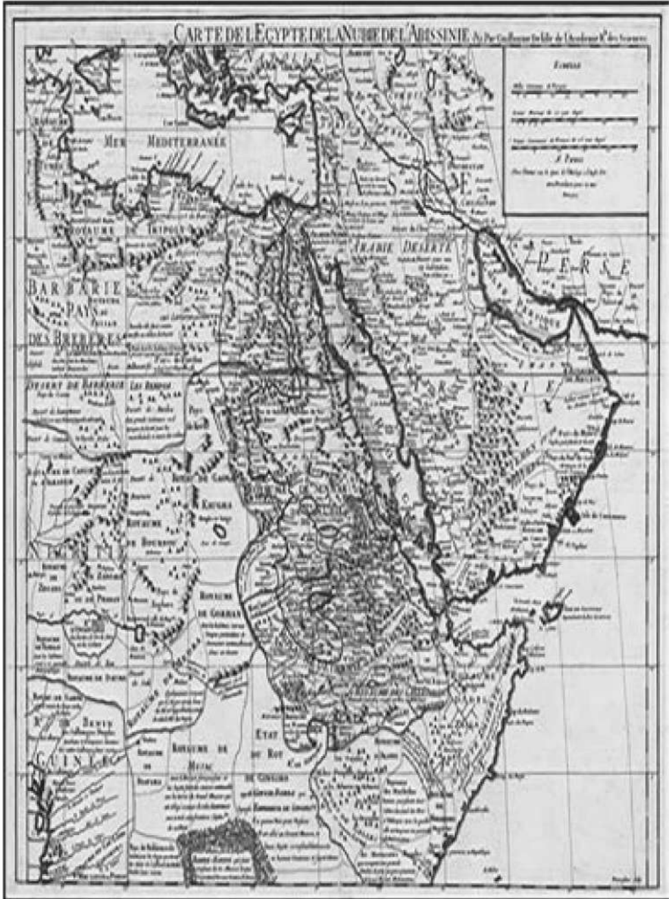
خريطة رقم (2) توضح مدينة المقاودة علي نهر عطبرة