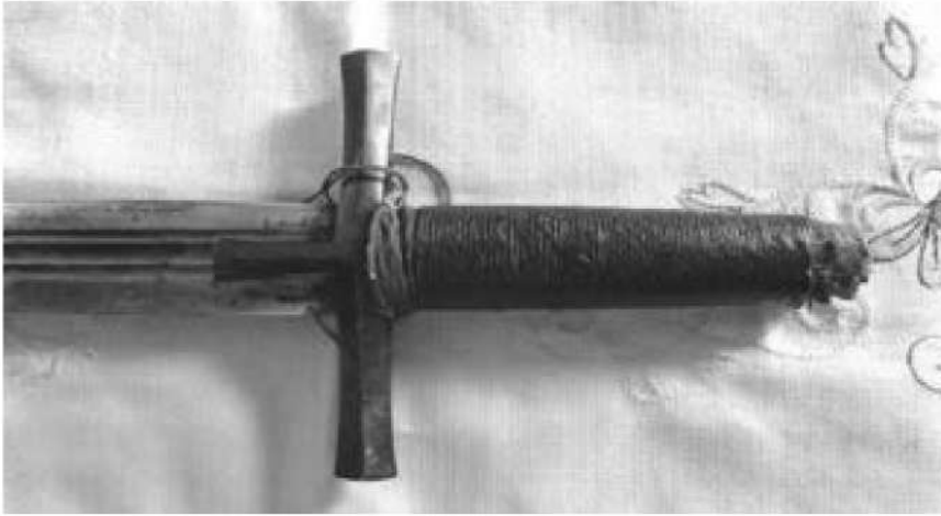
صورة رقم (12) مقبض ا-لسيف (مربوط به حرير أحمر)