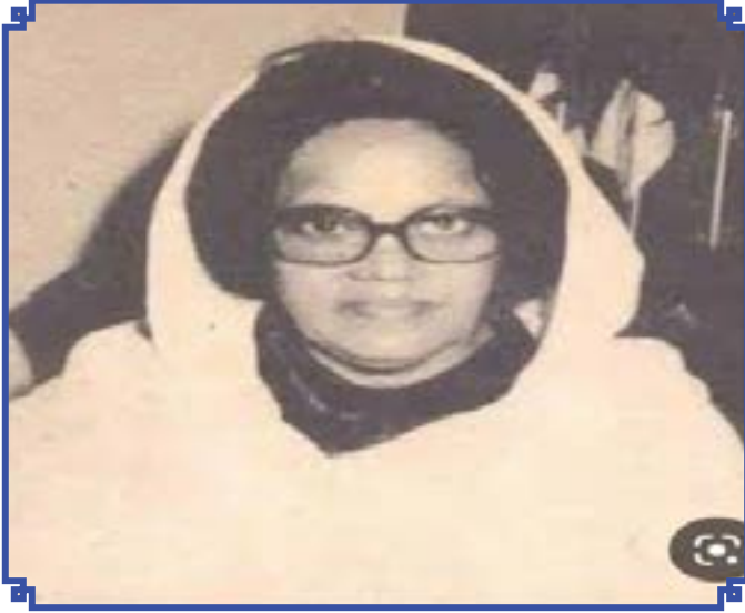
البروفيسور / حجة كاشف بدري